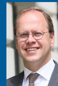
Stefan Rehder VIA GmbH