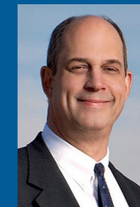
David Iben Kopernik Global Inv.