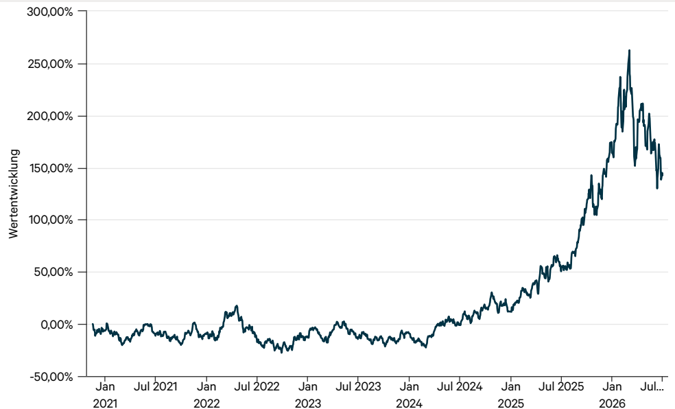
— Value Intelligence Gold Company Fonds AMI P (a)