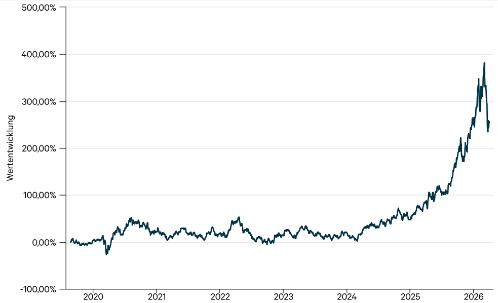
— Value Intelligence Gold Company Fonds AMI I (a)