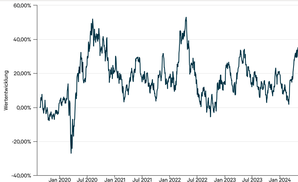
— Value Intelligence Gold Company Fonds AMI I (a)