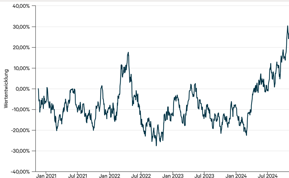
— Value Intelligence Gold Company Fonds AMI P (a)